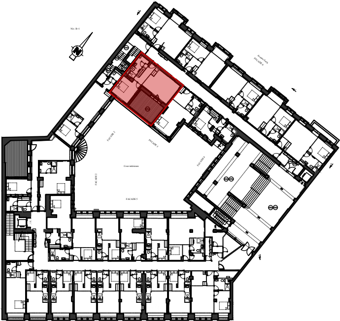
Tableau des surfaces

SNC IP1R 17, Avenue François Mitterrand 57017 METZ ICADE